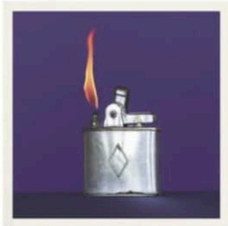
La pochette de J'mettrai le feu .

Un exemple qui leur a prouvé que c'était